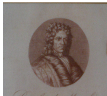
Paolo De Matteis

Paolo De Matteis (Piano Vetrale, 9 febbraio 1662 [1] – Napoli, 26 luglio 1728) è stato un pittore italiano, attivo in particolare nel Regno di Napoli tra la fine del Seicento e l'inizio del Settecento.