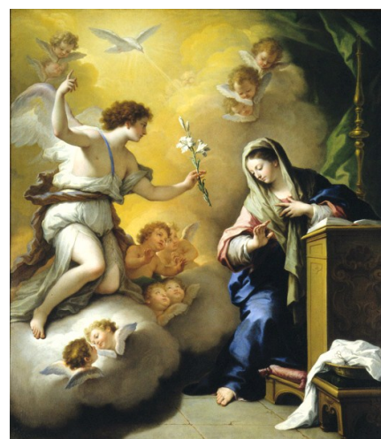
Annunciazione (olio su tela, 1712). Saint Louis Art Museum